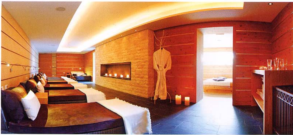
Der Ruheraum im Hotel Gut Weissenhof in Radstadt.